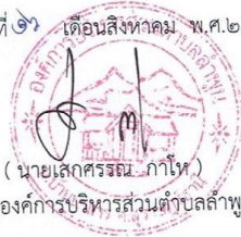
นายกององค์การบริหารส่วนตำบลลำพูน

ประกาศ ณ วันที่ ๒๕ เดือนสิงหาคม พ.ศ.๒๕๖๐